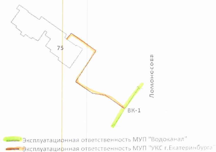
Схема разграничения эксплуатационной ответственности по водопроводным сетям.

соединительный элемент после задвижки на трубопроводе (в колодце) в сторону абонента в колодце (в колодцах) ВК№1 (см. схему);