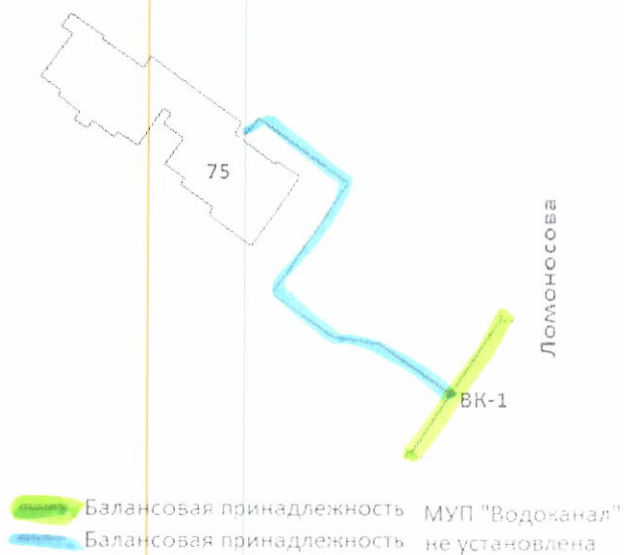
Схема разграничения балансовой принадлежности по водопроводным сетям.

2) границей балансовой принадлежности объектов централизованной системы водоотведения организации водопроводно-канализационного хозяйства и абонента является: наружная стенка колодца (колодцев) № 1 в сторону абонента (см. схему)